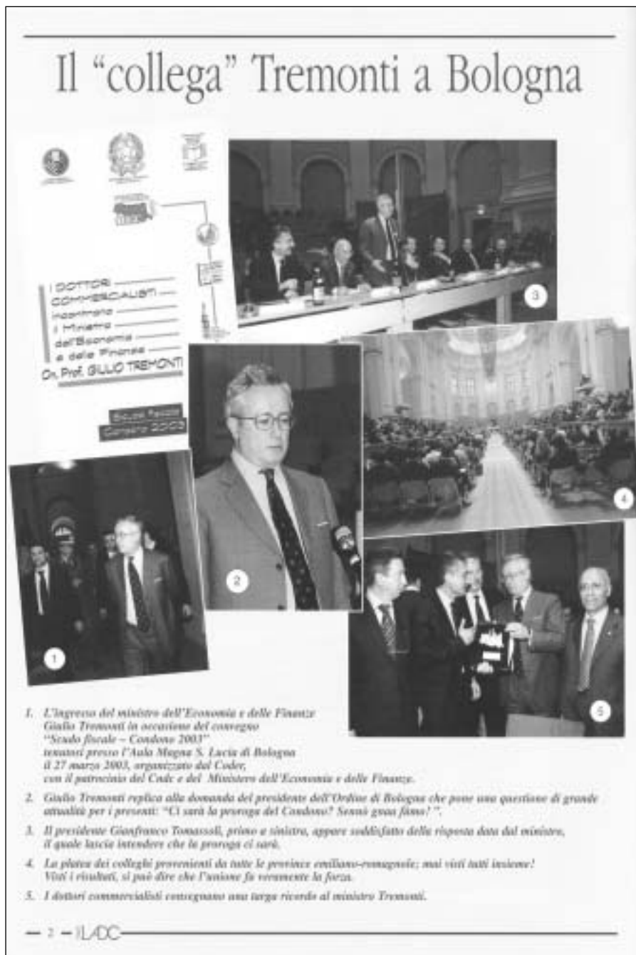
1. L'ingresso del ministro dell'Economia e delle Finanze Giulio Tremonti in occasione del convegno "Scudo fiscale - Condono 2003" tenutosi presso l'Aula Magna S. Lucia di Bologna il 27 marzo 2003, organizzato dal Coder, con il patrocinio del Coda e del Ministero dell'Economia e delle Finanze. 2. Giulio Tremonti replica alle domande del presidente dell'Ordine di Bologna che pone una questione di grande attualità per i presenti: "Ci sarà la prorroga del Condono? Se non è così fino?". 3. Il presidente Gianfranco Tomassoli, primo a sinistra, appare soddisfatto della risposta data dal ministro, il quale lascia intendere che la prorroga ci sarà. 4. La platea dei colleghi provenienti da tutte le province emiliano-romagnole; mai visti tutti insieme! Visti i risultati, si può dire che l'ansione fu veramente la forza. 5. I dottori commercialisti consegnano una larga ricorda al ministro Tremonti.

Il ministro Tremonti intervenuto al convegno tenutosi il 27 marzo 2003 presso l'Aula Magna di Santa Lucia