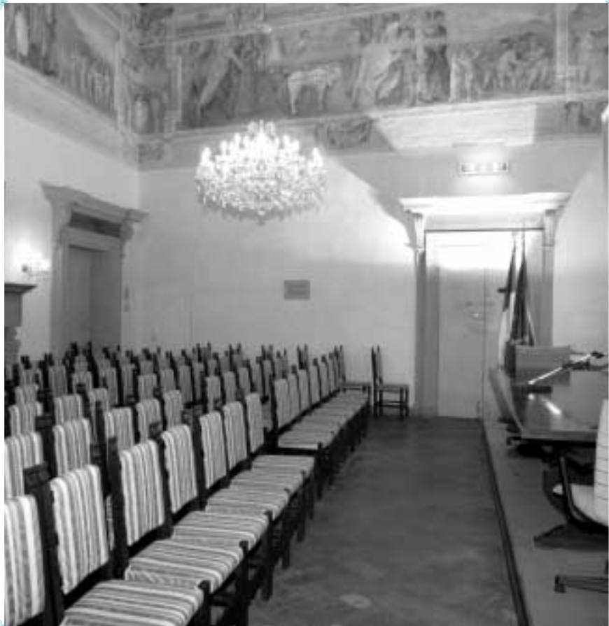
Sala conferenze di Palazzo Vassé Pietramellara Sede della Fondazione e dell'Ordine dei Dottori Commercialisti di Bologna