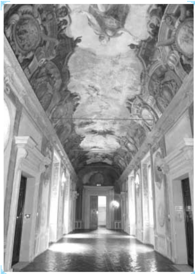
Galleria al piano nobile di Palazzo Vassé Pietramellara Ingresso della sede della Fondazione e dell'Ordine dei Dottori Commercialisti di Bologna